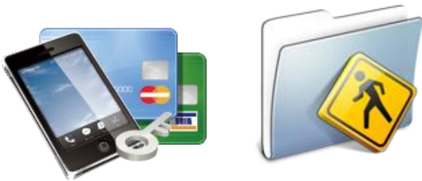
[인증서 / OTP 지원]