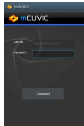
mCUVIC for Windows