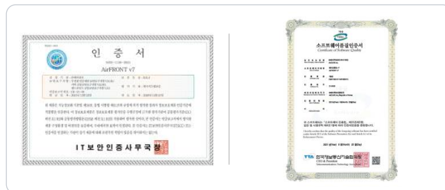
국가정보원 EAL-4 CC 인증